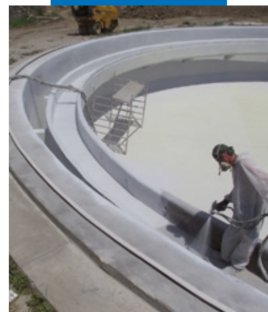
Applicazione di Purtop 1000 in vasche industriali