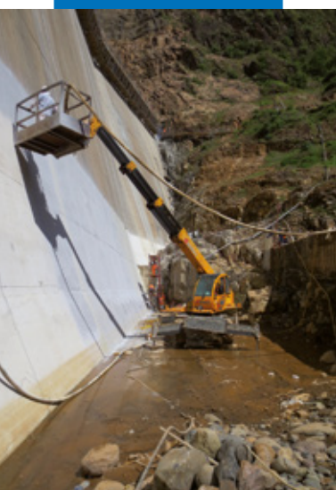
Impermeabilizzazione di diga