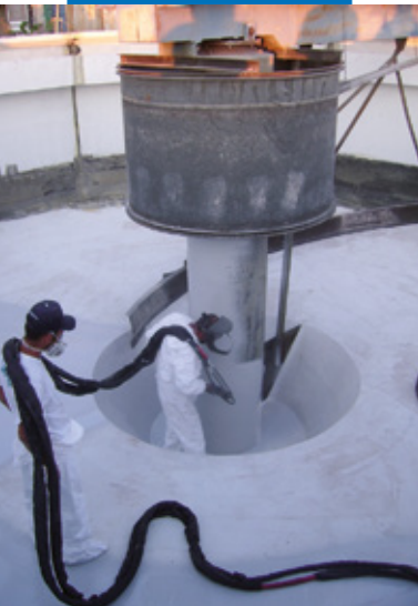
Dettaglio di impermeabilizzazione con Purtop 1000 su supporti vari (cementizi e metallici)