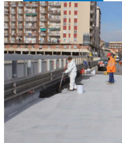
Applicazione di Purtop Primer Nero

Per ulteriori e complete informazioni riguardo l'utilizzo sicuro del prodotto si