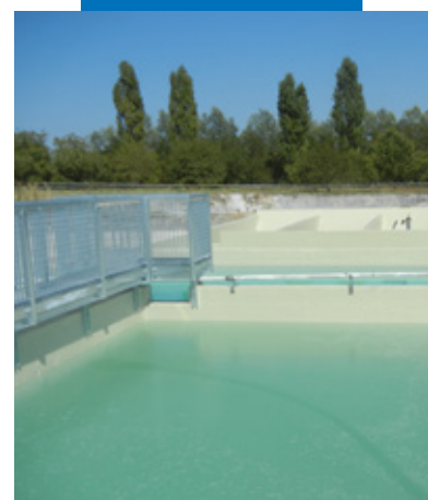
Vasche impermeabilizzate con Purtop 1000