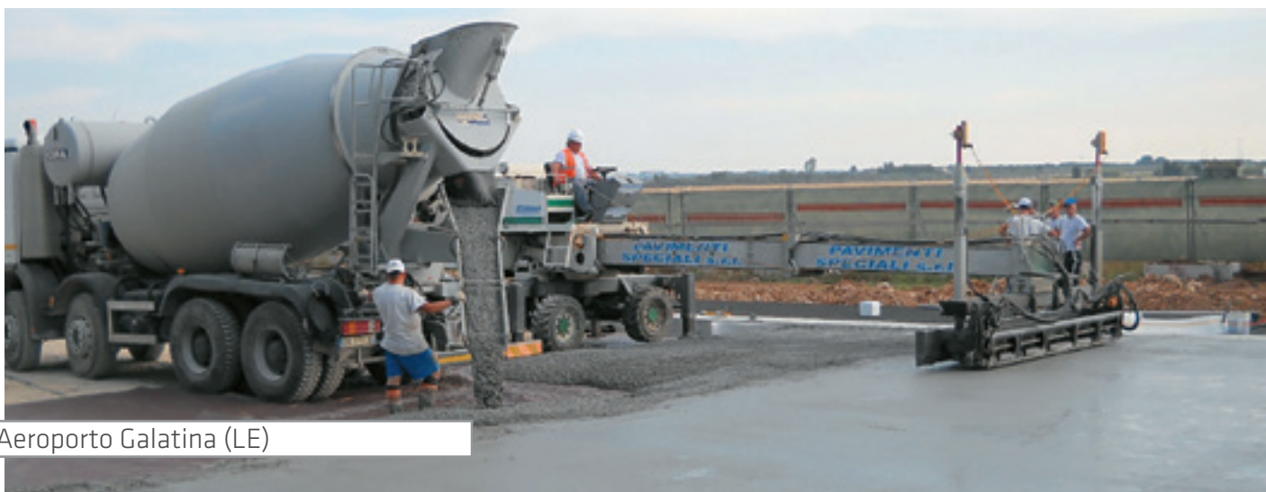
Aeroporto Galatina (LE)

These solutions respond excellently to needs not resolved by 'traditional' concrete flooring (phenomena of cracking following the hygrometric shrinkage).